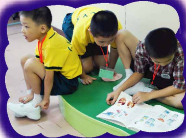
你看的圖書，我也愛看！