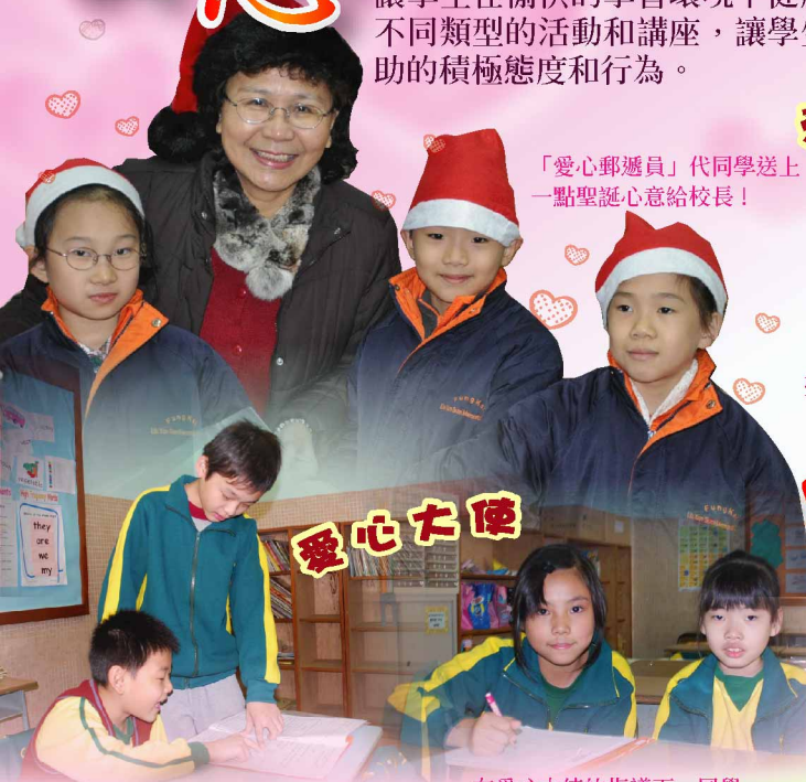
「愛心郵遞員」代同學送上一點聖誕心意給校長！

學生培育組以培養學生自重、自律、自愛為目標，我們以關愛的心和多元化的學習活動，讓學生在愉快的學習環境下健康成長。本年度學生培育組以建立和諧校園為目標，我們安排不同類型的活動和講座，讓學生明白互諒、互助、互愛的好處，從小養成互相關愛，互相幫助的積極態度和行為。