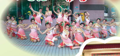
高年級組的同學以一整匹辣椒，加上甜美的笑容，在全年度元朗區舞蹈比賽中獲得銀獎！