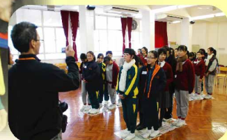
大家同坐一條船，齊心就事成。