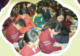
學好升中面試技巧，便能對答如流。