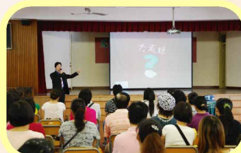
家長參與講座，掌握教子良方，如獲至寶！（「提升記憶全攻略」家長講座）