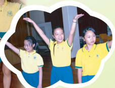
普通話話劇小演員演出維妙維肖，除了努力外，還有演藝細胞！