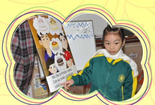
Let's read with me!

本年度我們在一、二年級同時推行「小學識字計劃」，鼓勵學生大量閱讀英文故事圖書，學習生詞。參與計劃的科任老師，會定期與教育局人員商討學習內容及學習活動。學生每周有四節英文故事課堂；每節課均由英語外籍教師和英文科教師一起任教，同時安排一位課室助理在課堂上協助推行學習活動。這有助減低師生比例，加強照顧學習差異。課堂上老師安排不同形式的學習活動，包括說故事、角色扮演、唱歌、拼音遊戲、生活體驗等，讓學生能寓學習於遊戲中，享受學習英文的樂趣。