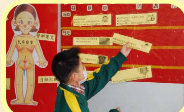
認識「青春期的轉變」，有助學生踏上健康成長路。（五年級性教育講座）