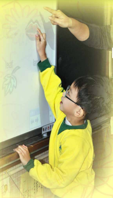
Can you find out the answer on the Smart Board?

為了培養學生閱讀英語故事的興趣，提高他們的讀寫能力，本校於2008年9月開始，小一英文科課程中引入教育局推行的「小學識字計劃」(Primary Literacy Programme - Reading and writing, 簡稱PLP-R/W)。經過一年的推行，學生對學習英語的興趣大為提升，同時初步掌握不同的閱讀策略及技巧。