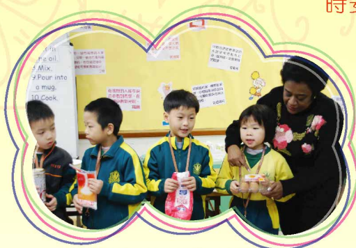
Pupils are going to make a chocolate cake.

本年度我們在一、二年級同時推行「小學識字計劃」，鼓勵學生大量閱讀英文故事圖書，學習生詞。參與計劃的科任老師，會定期與教育局人員商討學習內容及學習活動。學生每周有四節英文故事課堂；每節課均由英語外籍教師和英文科教師一起任教，同時安排一位課室助理在課堂上協助推行學習活動。這有助減低師生比例，加強照顧學習差異。課堂上老師安排不同形式的學習活動，包括說故事、角色扮演、唱歌、拼音遊戲、生活體驗等，讓學生能寓學習於遊戲中，享受學習英文的樂趣。