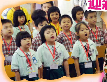
開學日，我們在唱校歌「燦爛的朝陽……」