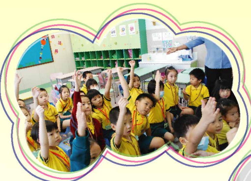
"I know the answer. Let me try!"