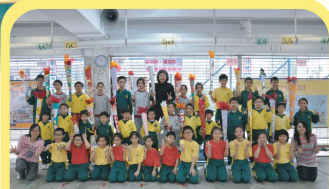
我們全力支持東亞運動會，yeah!