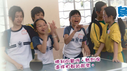
勝利的歡呼,熱到得連球拍都站起來。