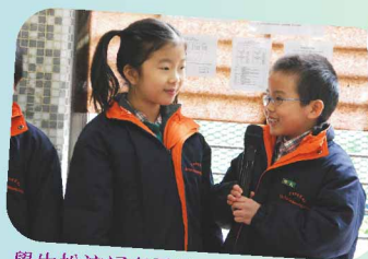
學生扮演記者及被訪者，以訪問形式介紹月訓主題〈儀容整潔〉。