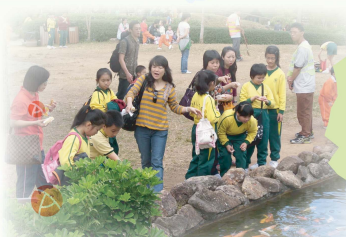
色彩燦爛的錦鯉,吸引了老師、同學和家長,大家全神貫注地欣賞。