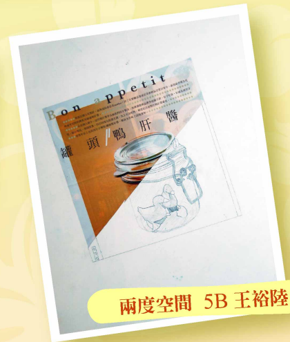
兩度空間 5B 王裕陸