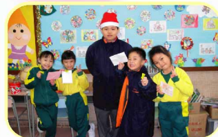
他是聖誕老人嗎？不！他是我們的「愛心郵遞員」！