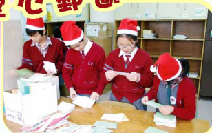
「愛心郵遞員」忙着整理，準備代同學送出聖誕卡，趕快派送到校長和老師手上！