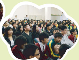
子女升中選校，家長豈能缺席？