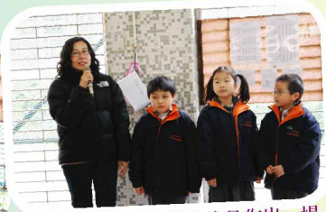
楊老師和我們的小演員作一場精彩演出。