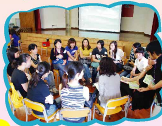
家長透過座談會與班主任聚首一堂，了解學生的學習需要。正是家校合作的第一步！