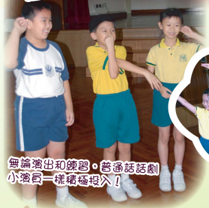
無論演出和練習，普通話話劇小演員一樣積極投入！