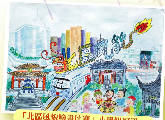
「北區風貌繪畫比賽」小學組冠軍 6D 莫鈞瑜