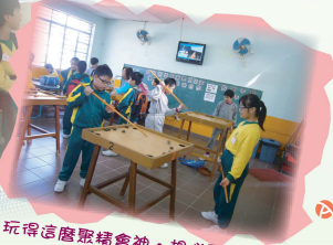
玩得這麼聚精會神,想必百發百中。