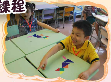
「哈！你砌的不像貓貓呢！」