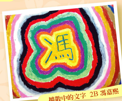
擴散中的文字 2B 馮嘉熙