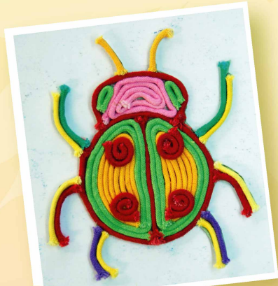
杯墊 5D 鄧文豪