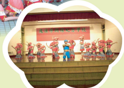
穿上漂亮服飾的低年級組同學，在全年度沙田區舞蹈比賽中獲得銀獎。看！他們多神氣喇！