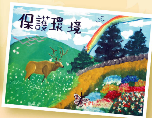
藍天綠地在北區 6E 陳偉寶