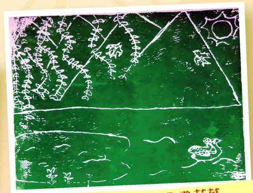
郊外風光好 4B 孫苑萬