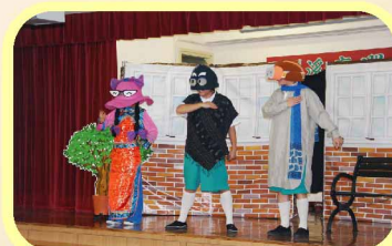
「藍藍的故事」中，對白惹笑，令人印象深刻！（「大細路劇團」劇團）