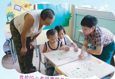
我教的小老師盡顯愛心，教導小訪客時，非常有耐性！