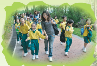
浩浩蕩蕩,我們雲遊遍大埔海濱公園。