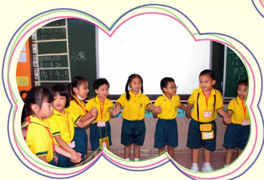
Pupils sing the chant 'Jelly on the plate' happily.