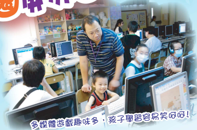
多媒體遊戲趣味多，孩子學習容易笑呵呵！