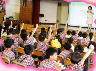
校長提問，「我會答！我會答！」小手舉不停。