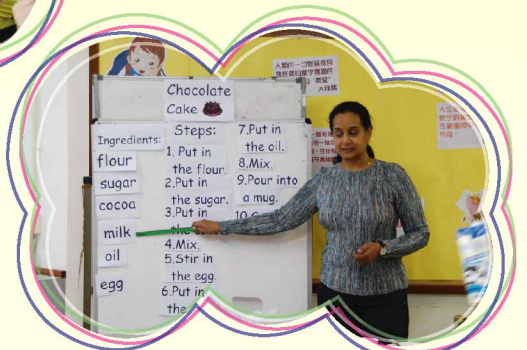
Ms Keshri teaches pupils the steps to make a chocolate cake.