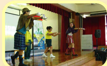
同學與演員一起唸抗煙口號，擊退吸煙魔王！（「無煙神探X」互動教育劇場）