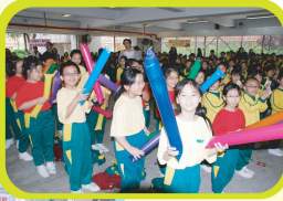
充滿活力的表演隊，正展示東亞活力操-