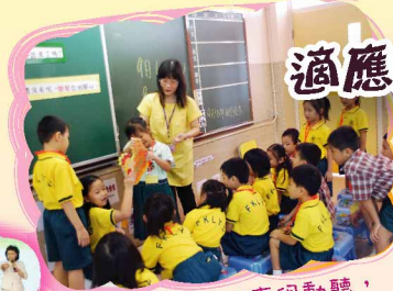
向老師的故事很動聽，母雞、小雞都來了。