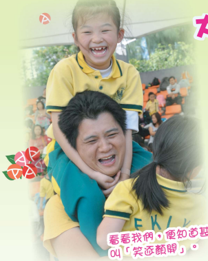
看看我們,便知道甚麼叫「笑逐顏開」。