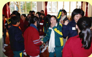
學懂建立人際關係，合作更愉快！