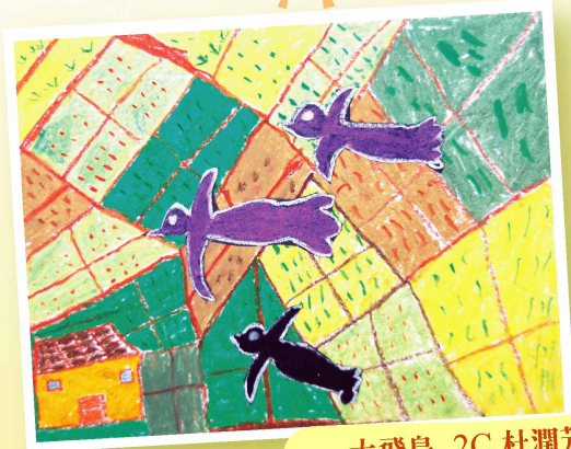
大飛鳥 2C 杜潤芳