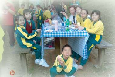
站着吃、坐着吃、蹲着吃,同樣滋味無窮。