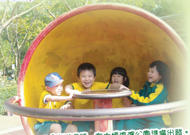
Over, over「塵環環號」在大埔海濱公園準備出發。