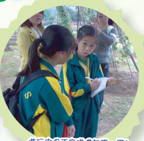
游玩中仍不忘地進知識、識!