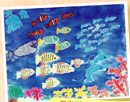
海底世界 3A 沈慧婷