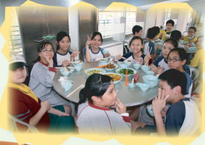
飯菜的味道早已忘記了,但同窗共膳的情景,卻永誌心中。