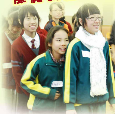
船快要破了，大家要加油呀！