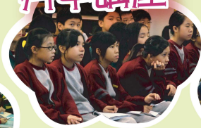
同學們專心聆聽，掌握足夠信息，為自己選出一間理想中學！