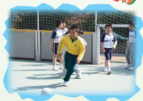
衝呀衝!等我來個「穩守突擊」。