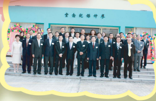
典禮前，主禮嘉賓律政司司長黃仁龍資深大律師與大家合照留念。