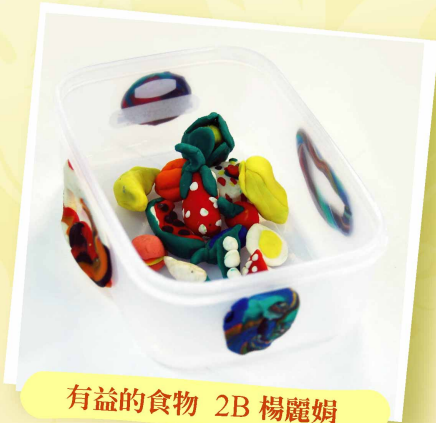
有益的食物 2B 楊麗娟