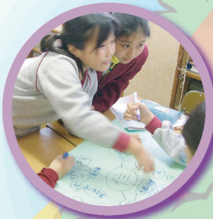
四年級同學透過小組互動，熱烈討論，製作主題網。

我校常識科本年度配合香港課程發展路向，在四及五年級推展專題研習計劃。在研習過程中，學生會從多種渠道，使用多元化的學習資料，主動建構知識。