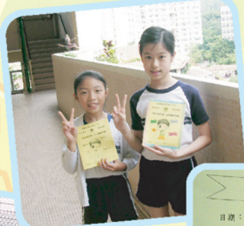
◀我們已取得了所有的「成功方塊」，Yehh!