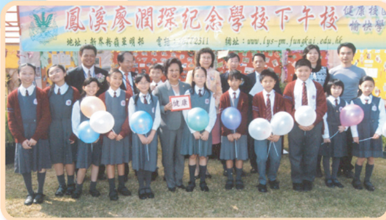
▲大家把握機會，跟嘉賓來一張合照。

本校於2004年之北區花鳥蟲魚展覽中設置攤位參展，讓學生與校外人士分享我們努力的成果。在是次參展中，本校學生展示了我們的努力成果——蔬菜及盆栽。透過種植活動，學生以有機耕作方法加強環保意識，亦學會了種植必須要有恆心及愛心。