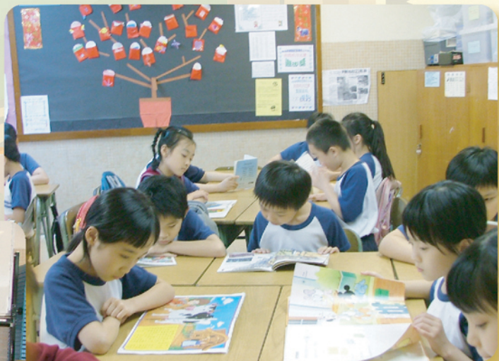
在「午間閱讀齊共享」活動中，大家都能感受到濃厚的閱讀氣氛。