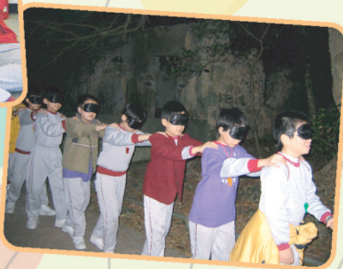
▲「再戰營會」之夜行歷奇活動，經驗又刺激！