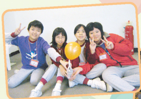
▲「證書行動」創意無限，挑戰難度。