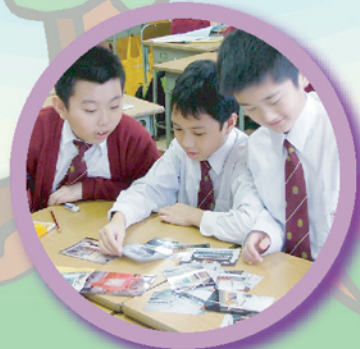
四年級學生搜集資料後，正進行資料分析，分析那一些資料適合用來製作專題研習報告。