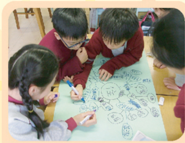
齊齊協作，設計主題網