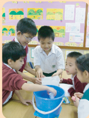
同學們正通過實驗，找出不同容器的容量。