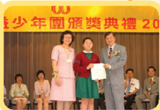
公益少年團頒獎典禮 20