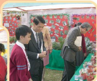
◀環保大使為嘉賓細心講解盆栽的資料。