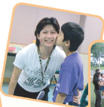
▲「親子一吻」，媽媽甜入心