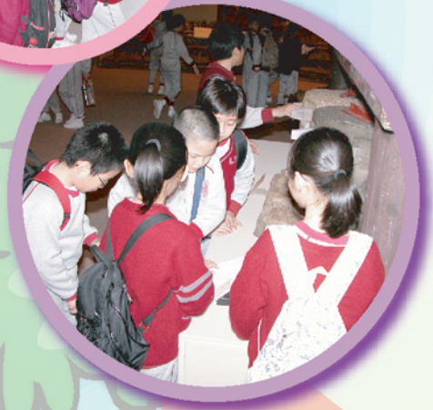
四年級同學正學習搜集資料，製作專題研習報告。