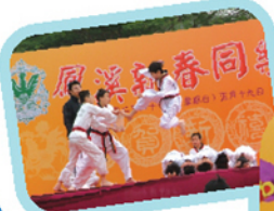
看我凌空飛踢碎板絕技，真的不簡單！