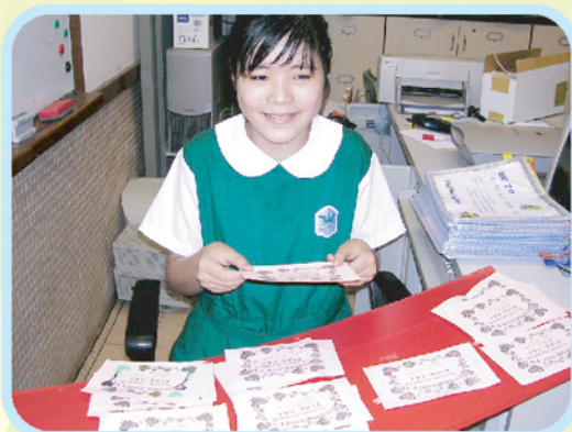
▲愛心郵差正忙碌地分發信件。

同學的積極參與，老師的大力支持，令這項活動達到了預期的效果：學生的責任感、自我形象及個人成就感亦得到了提升。