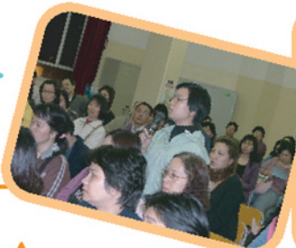
家長們專心聆聽和認真發問。