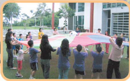
▲「親子黃昏營」共享天倫樂