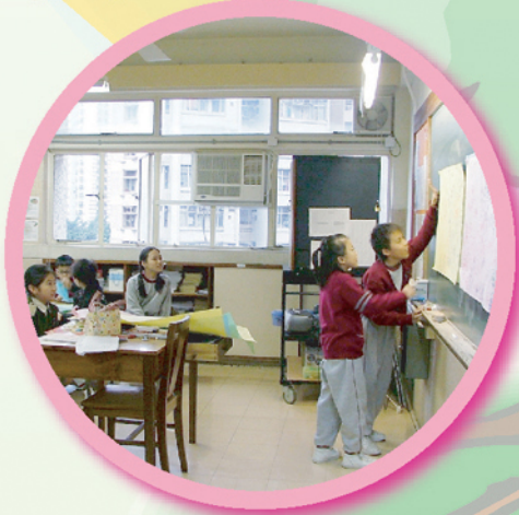
完成主題網後，向全班同學匯報，分析主題網內有用的資料。