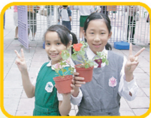
▼你看！我的花盆多漂亮！