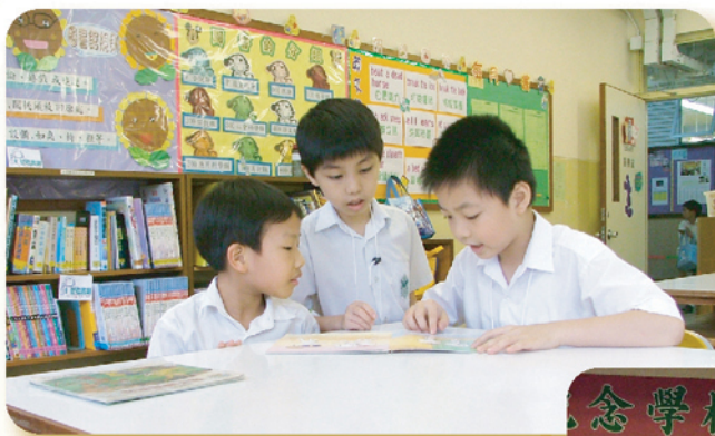
閱讀大使正為學弟學妹進行伴讀。