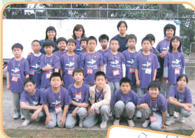
▼「成長的天空」挑戰日營 大合照