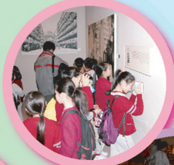
四年級同學在戶外學習日，進行實地考察，參觀歷史博物館。