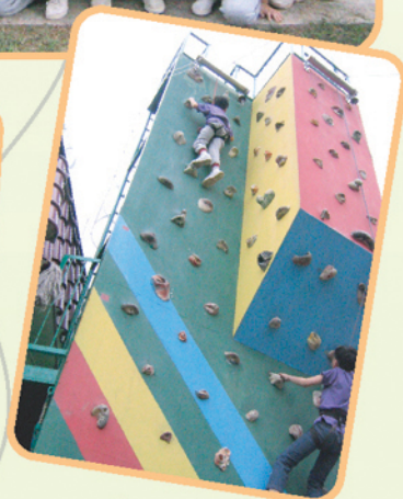
▲「個人攀石活動」是信心和勇氣的考驗