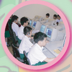
五年級學生利用電腦進行資料搜集，學習運用資訊科技。